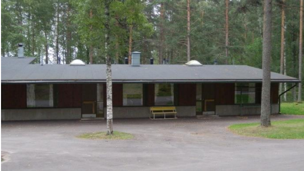
Kauniskallion päärakennuksen majoituspuoli